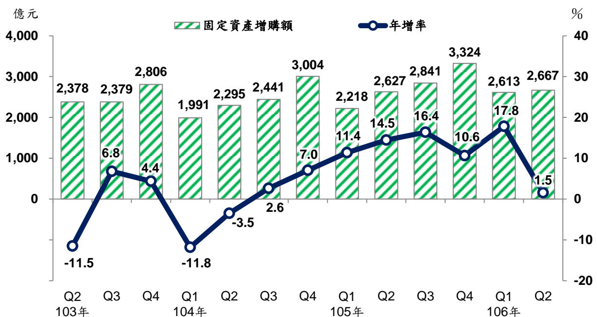
製造業固定資產增購金額及年增率

106年第2季製造業國內固定資產增購2,667億元，較上季增2.0%，較上年同季增1.5%，為連續8季正成長，惟因去年同季有部分業者逢設備裝機期，比較基數高，致年增幅度較緩。按固定資產型態分，以機械設備增購2,331億元(占87.4%)居首，年增2.9%，房屋及營建工程308億元(占11.5%)居次，年減9.1%，交通及運輸設備28億元，年增29.2%。累計上半年固定資產增購5,280億元，較上年同期年增9.0%。