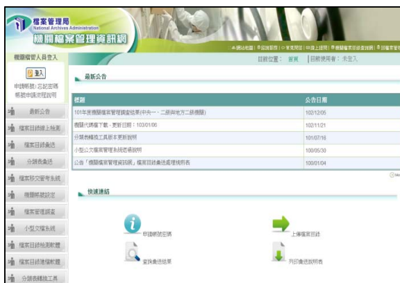
機關檔案管理資訊網