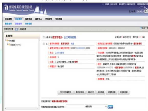
機關檔案目錄查詢網

(二)公文送交：各機關每半年辦理目錄彙送作業時，應按檔案法施行細則第 10 條規定之送交程序，備函並檢附檔案目錄彙送說明表送交本局。