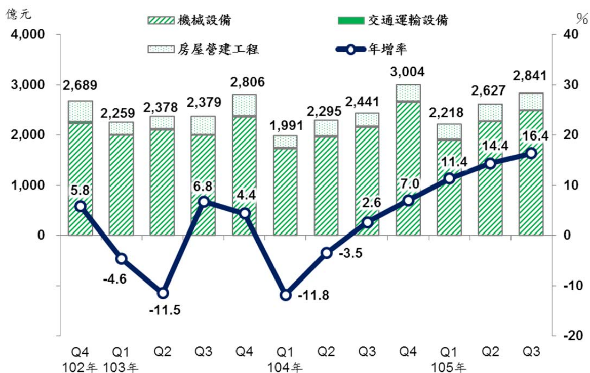
製造業近年各季固定資產增購額及年增率