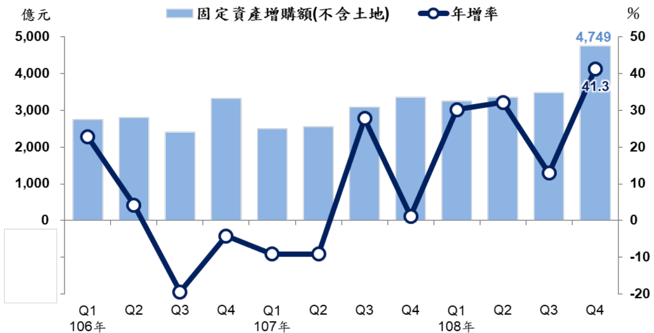
製造業固定資產增購金額及年增率