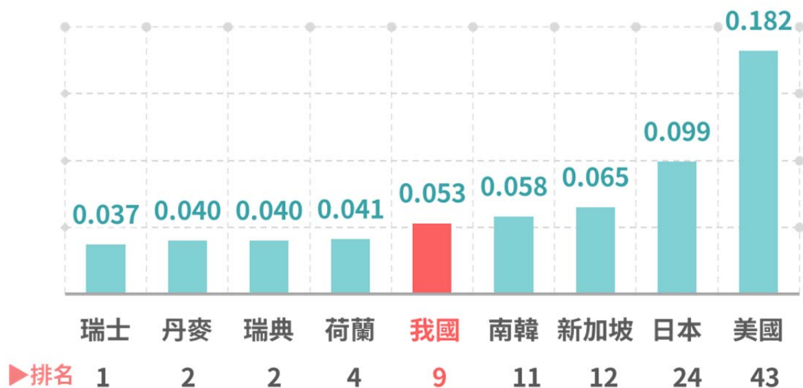
圖1. 2018年主要國家性別不平等指數(Gender Inequality Index, GII)與排名