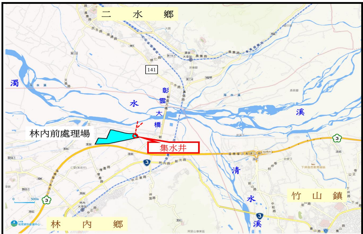
圖 7-2 濁水溪伏流水工程示意圖