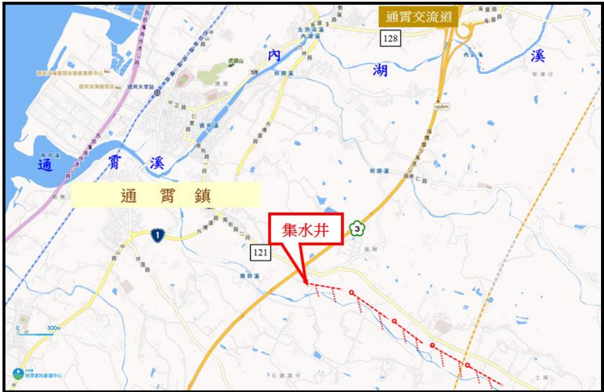
圖 7-1 通霄溪伏流水工程示意圖