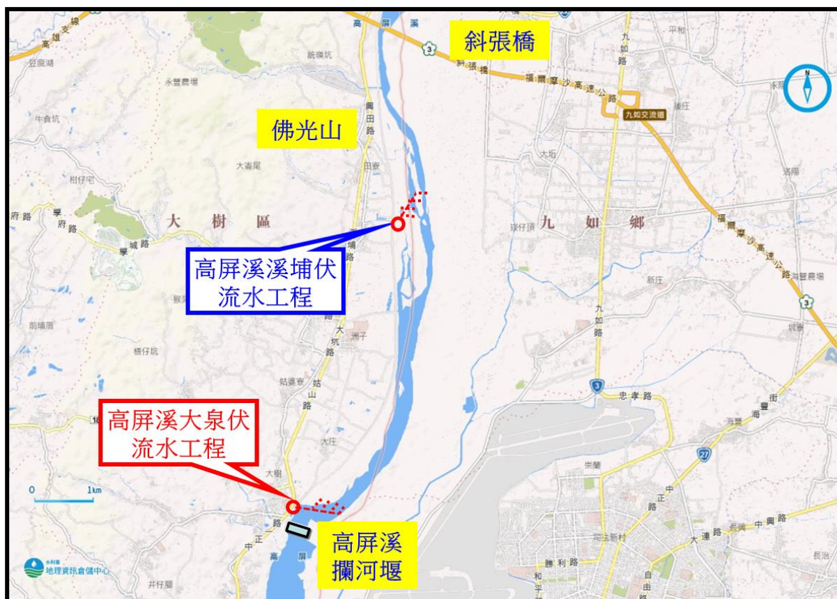
圖 7-3 高屏溪伏流水工程示意圖