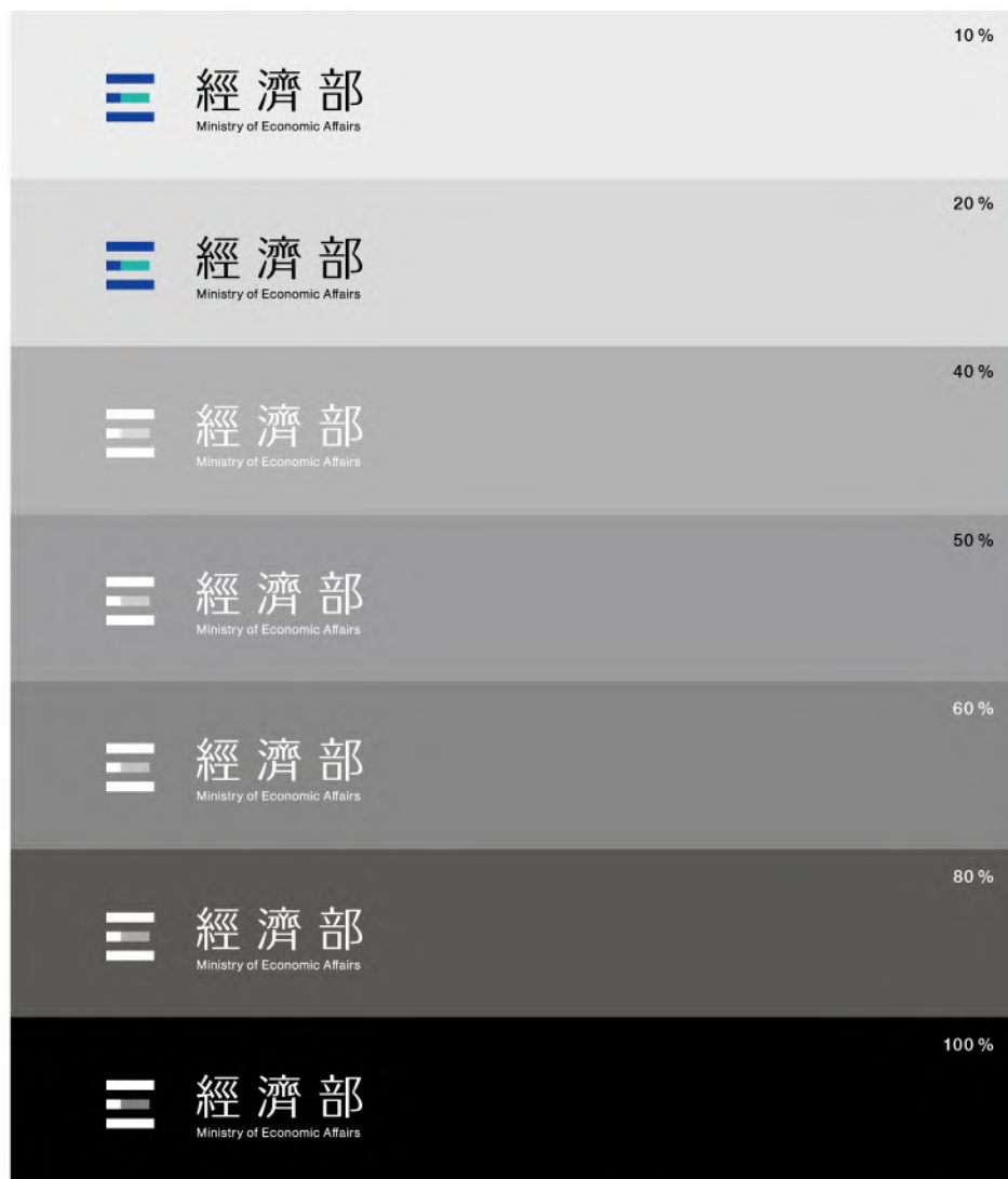
當背景色灰度為40%~100% 標誌須轉換為相對應的色彩形式